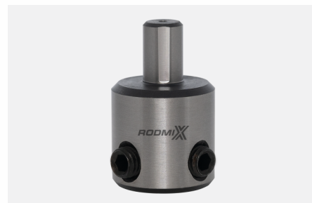
Артикул 1420125191 Переходник с Ц/Х на Weldon 19