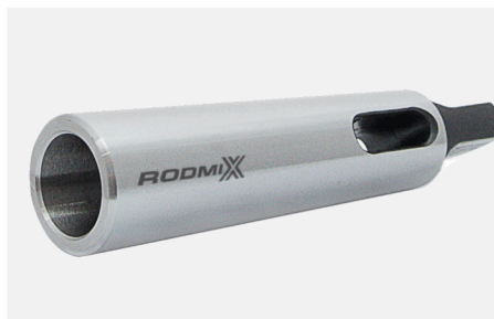
Артикул 1421030200 Переходник с КМ3 на КМ2