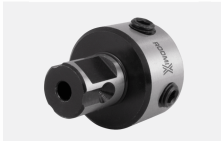
Артикул 1420000192 Переходник с Universal (Nitto, One-touch) на Weldon 19