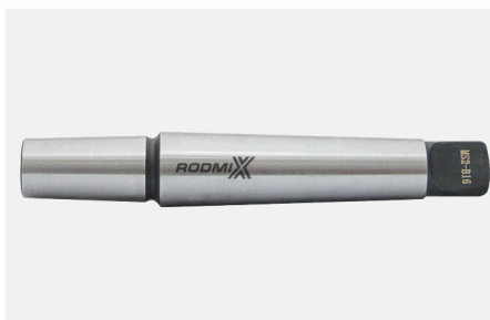
Артикул 1422021600 Переходник с КМ2 на В16