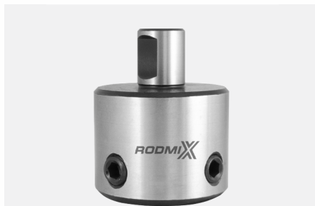
Артикул 1420019321 Переходник Weldon 19 на Weldon 32