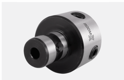
Артикул 1420000191 Переходник с Quick-in на Weldon 19

Широкий ассортимент переходников и адаптеров позволяет использовать корончатые сверла с различными станками.