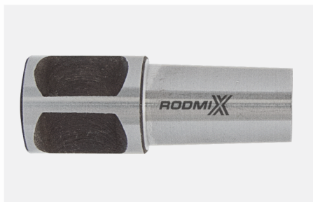
Артикул 1420019161 Переходник Weldon 19 на В16